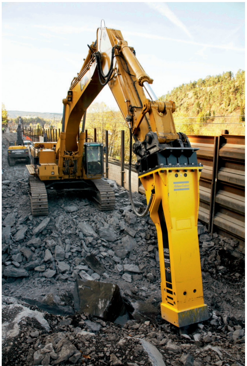
1 Hydraulikhammer at work: Angeflanscht an Bagger von mehr als 85 Tonnen Eigengewicht, verrichtet der ›HB10000‹ seine Abbrucharbeit

In gleichem Maß entwickelte sich die Leistungsfähigkeit der Fertigung. In Produktionshallen, in denen einstmal der Krupp'sche Lokomotivbau zu Hause war, stellt man heute unter hochrationellen Bedingungen Hydraulikhämmer her. Gefertigt wird hier das Schlagwerk, bestehend aus Deckel, Schlagkolben, Zylinder- >>>