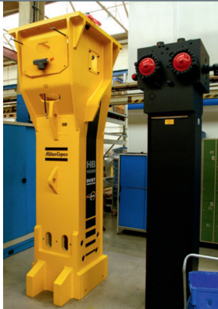
2 Der HB10 000, der Größte seiner Klasse, vor dem Zusammenbau: Hammerkasten (links) trifft auf Schlagwerk

Auch die Entwicklung und Fertigungsplanung haben ein hohes Niveau erreicht, das zudem stetig ausgebaut wird. In Sachen Betriebsmittelverwaltung vertraut man auf den Partner FasyS Industrie-EDV-Systeme, dessen Toolmanagement-Software FATool seit 2002 im Hause ist. Angefangen bei den Werkzeugen und NC-Programmen werden künftig sämtliche Betriebsmittel verwaltet. Alle fertigungsrelevanten Daten sind somit zentral erfasst, können verknüpft und an die NC-Programmierung übergeben werden. Einmal eingegeben,